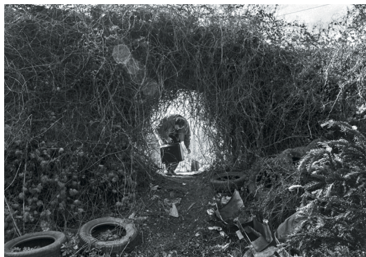
Libeň 2005: „Zkratka od tramvaje, dřív tu byly sběrné suroviny, teď je to brownfield, kde už se staví.“