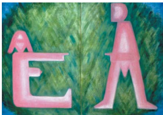
Eva a Adam, olej na plátně, 1995.

Jistě, „A“ je počátek, základ. Namalovala jsem i Izáka, který se na otce tázavě dívá. Jednomu stoletému františkánu se ten obraz strašně líbil a v Izákově pohledu viděl důvěru k otci. Zkrátka, co mi vrtalo hla-