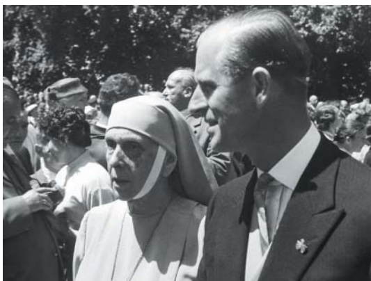
Princezna Alice se synem Filipem, manželem královny Alžběty II., roku 1957.

Tchyně Alžběty II., matka jejího manžela Filipa (1921–2021), byla princezna Alice, praprapravnučka královny Viktorie. Od narození hluchá žena se provdala za řeckého prince Edvarda. Ze svazku se narodili čtyři potomci, tři dcery a syn. Všechny dcery podporovaly nacismus a za manžele si vybraly skalní nacisty. Jen syn Filip