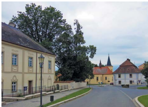
Zámek, kostel a děkanství ve Spáleném Poříčí.

duje se, že majitelé panství Vratislavové z Mitrovic, usilující o celkovou obnovu