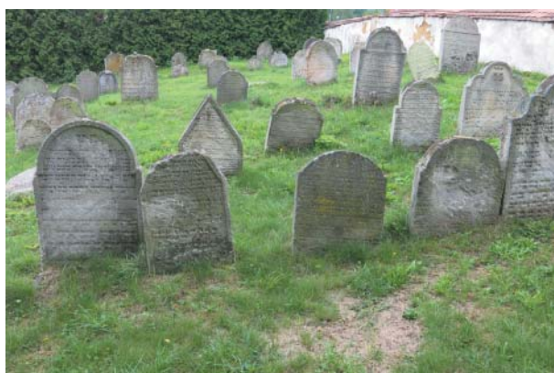
Hřbitov, založený v polovině 18. století.

Až do poloviny 19. století žili zdejší souvěrci v ghettu v dnešní Tyršově ulici a oko-