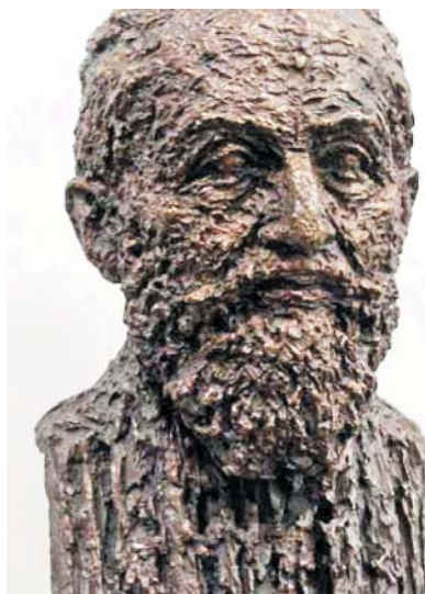
Busta Barucha J. Placzka od Nikose Armutidise.

čit možnost, že tento pseudonym nebyl jediný. Ve třiatřiceti mu vyšla první sbírka básní Veruvu (tedy: v území spojujícím židovské domácnosti o šabatu, a tím přeneseně i uvnitř židovských tradic a náboženských zvyků, 1867). Formou obvyklou v německé poezii své doby zpracovává ryze židovská témata. Patří k nim náboženské motivy jako Kiduš levana (požehnání měsíce) či Sváteční kytice (lulav), nářek dívky, jejíž milý odešel na studia za svým rabínem ( Stará píseň ), soudržnost i rozpory v ži-