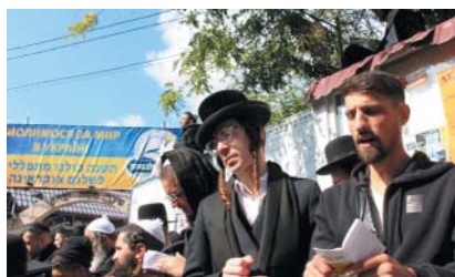
Letošní oslavy Nového roku v Umani.

Liz Trussová, nová britská premiérka, dala zřetelně najevo, že bude podporovat britskou židovskou komunitu i Stát Izrael.