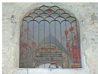
Restaurovaná výmalba, pohled z hlavního sálu.