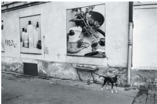
Libeň 2022: „Nejnovejší obrázek na výstavě. Ta kuchyňská reklama jsou zaslepená okna hospody U Prcka, jedné z Hrabalových základen.“

Jo, změny přišly v rámci celé školy. Ale na FAMU jsou pořád nějaké změny, současné problémy už nestíhám sledovat. Výsledkem těch tehdejších bylo, že řemeslo muselo ustoupit nějaké současnější ideji umění, kdy fotografie není zajímavá svou technickou kvalitou, ale nějakou výpově-