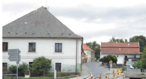
Pohled do bývalého ghetta, v popředí Weilův dům.

Nejvýznamnější památkou na Židy ze Spáleného Poříčí a okolí je ovšem místní