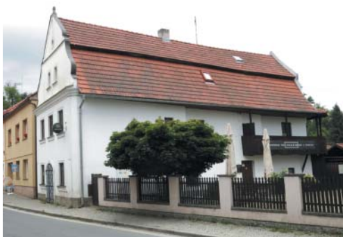
Ledererův dům, dnes penzion a restaurace Joachim Lewidt.

svého panství, zde povolili pobyt židovským obchodníkům, základu početné obce, která tu potom od 17. do 19. a v menší míře i do 20. století existovala. Městečko se v čase baroka i později rozrůstalo a mnohé z budov a domů, které postupně v centru vznikaly, jsou dnes chráněny jako městská památková zóna. V roce 2003 získalo Spálené Poříčí dokonce ocenění Historické město roku.