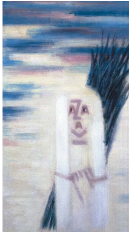
Izák, olej na plátně, 1998.