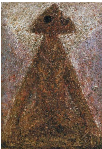
Job II, akronex, písek, kamínky na plátně, 1964.

zabývat Biblií. Starozákonními příběhy, které jsou fantastické, pak Novým zákonem, až jsem se pak roku 1958 nechala pokřtít. A mezitím jsem začala malovat věci spojené s Biblií.