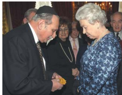
Alžběta II. při setkání s přeživšími holokaust.

Nový král Karel III. má vlastní kipu: modrou sametovou jarmulku se zlatou a bílou přízí vyšitým emblémem prince