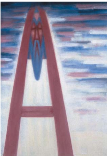
Abraham 2, olej na plátně, 1996-98.

tvárných umění a nesměla vystavovat. Díky podpoře rodiny a podobně smýšlejících a režimem perzekvovaných přátel pracovala v ústraní a hledala si svou svěbytnou uměleckou cestu. V jejím díle lze nalézt různé vlivy, od surrealismu přes informel po experimenty s písmem a slovem, věnovala se také knižní