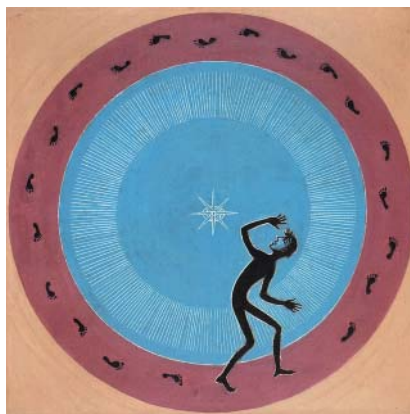
Věra Nováková Bludný kruh I z cyklu Jonáš , 1955.