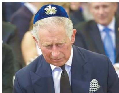
Král Karel III. a jeho kipa.

(Připomeňme, že podobně se Židé v zemích Rakouska-Uherska modlili za císaře Franze Josefa a že v modlitební