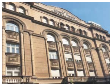
Bělehradské židovské muzeum.

lem deváté hodiny, kdy horký den přechází v příjemný teplý večer. Celé prostranství je zaplněno, lidé se porůznu rozsazují před pódiem, v davu kolem sebe slyším srbštinu i hebrejštinu. Hlavní zpěvák skupiny každou píseň (s ohledem na mezinárodní složení publika) uvádí v angličtině, vysvětluje obsah sefardských legend a příběhů, na jejichž motivy je většina písní složena – jako třeba ta o kantorovi, jehož Turci donutili zazpívat z minaretu a který se ze zoufalství vrhl dolů. V momentě, kdy místo anglicky začne zpěvák do mikrofonu