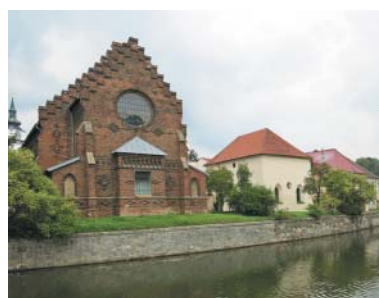
Nová a Stará synagoga ve Velkém Meziříčí.