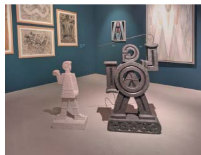
Goliáš a David, 2002. Foto z výstavy am.

Goliáš stojí na tanku, vepředu má hákový kříž a na zádech pěticipou hvězdu, ty objek-