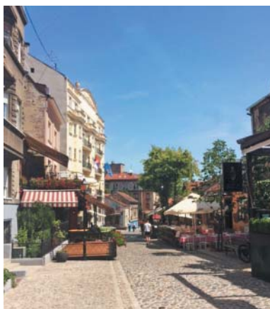
Jedna z ulic ve čtvrti Dorćol.

přes rozlehlé náměstí Studentski trg, na jeho konci se dát doprava kolem budovy Etnografického muzea – a po pár minutách jsem tam. V malebné, zastrčené části bělehradského centra, jež je oproti zbytku města nezvykle klidná a díky množství zeleně zde není takové parno (i když v létě celý Bělehrad sálá jako hučící rozpálená kamna), ve čtvrti Dorćol. Tato čtvrť, jejíž název pochází z turečtiny, je plná malých kaváren, podniků a pozůstatků osmanské architektury a svojí pozoruhodnou atmosférou chvílemi připomíná Paříž, jindy zas jakési zcela neevropské město.