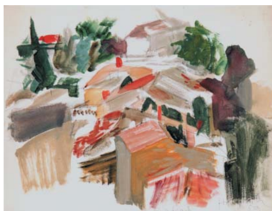
Bordeaux, kvaš, papír, 1959.

V Anglii získala v letech 1942–1943 od československé vlády stipendium a mohla se opět věnovat více malování. Výsledkem byla její první samostatná výstava v červnu 1943 v The Czechoslovak Institute v Londýně, kde vystavila přes třicet prací – převážně surrealistické kresby, akvarely a obrazy, na nichž vytvářela