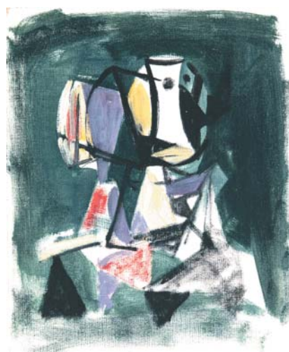
Hlava , olej na plátně, 50. léta.