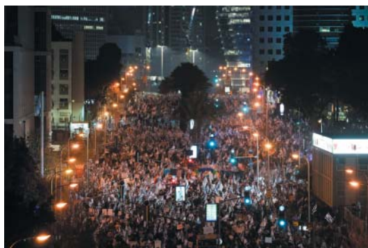
Do ulic vycházejí demonstrovat statisíce Izraelců.

něji přiblíží ostatním demokraciím. Ani jeden seriózní právník v Izraeli nevěří, že to je pravda.