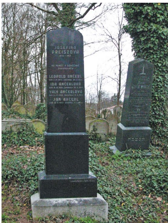
Památce Ančerlova otce, matky, ženy a syna na hřbitově v Tučapech.

události podnítily to druhé. Já sice někdy propadám náladě „naší rase vlastní“, ale většinou se směji také. Jen mne hrozně užírá, že původci jsou tak často z nás. Něco, čemu jsem při svojí hlouposti nemohl nikdy věřit, až když jsem se o tolika případech přesvědčil, začínají se mi otvírat oči.