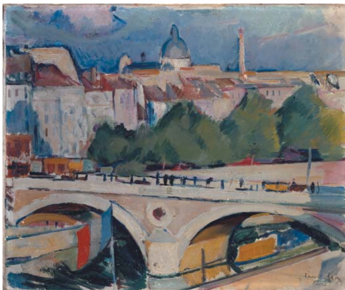
Rudolf Levy: Pohled na Pont Marie, 1910 .

Dvacátá léta, proslulá „années folles“, znamenala nástup jazzu, rozhlasu a filmu a přinesla celkové oživení, které symbo-