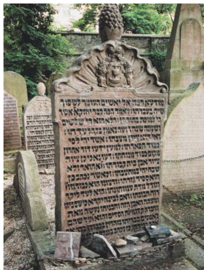
Hrob Jechezkela Landaua na židovském hřbitově v Praze-Žižkově, ve Fibichově ulici.

Pokud bychom chtěli hodnocení Landauova působení ve vztahu ke státu uzavřít tak, že vždy volil cestu kompromisu, nebyla by to pravda. Důkazem budiž jeho boj za zachování tradiční podoby židovského pohřbu. Podnětem k němu byly všeobecné pohřební reformy, jimiž se stát snažil vylepšit zdravotní stav populace a jež opět jednou citelně zasáhly do židovského života. Výsledkem bylo mj. rušení hřbitovů uvnitř měst (včetně pražského Starého židovského hřbitova), povinnost lékařského ohledání zesnulého a získání úředního povolení k pohřbu, který směl proběhnout až po uplynutí dvoudenní čekací lhůty.