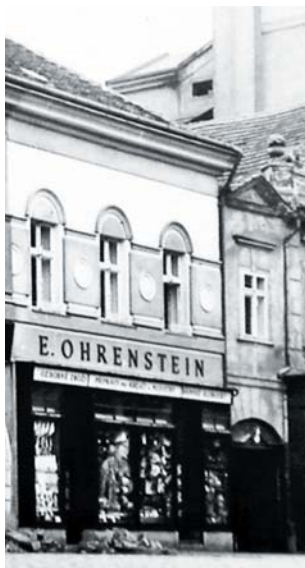
Obchod v Kollárově ulici. Foto archiv.

Začátkem prosince 1940 Berta synovi Jiřímu děkuje za přání k narozeninám a dodává: „Byla jsem tak hrozně sama, tak opuštěná, že jsem si po dlouhé době zaplakala. Vzpomínala jsem, jak to bylo krásné, když jste byli všichni doma, i s tátou. (...) Ve čtvrtek má mně být v dražbě prodán klavír a stříbrník. Nemožu zaplatit do Sudet K 5000, a proto na