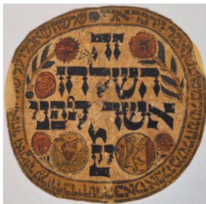
Tabulka Ze ha-šulchan, druhá polovina 18. století. Z genizy synagogy v Luži. Archiv ŽMP.