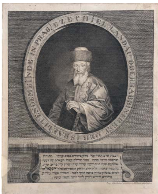
Markus Klauber: Portrét Jechezkela Landaua, Praha, 20. léta 19. století. ŽMP, inv. č. 012.565.

Počátkem zásadních změn života Židů v habsburské monarchii byla bezpochyby série tzv. židovských tolerančních patentů, z nichž jako první byl 19. října 1781 vydán dokument pro české Židy (viz Rech 10/2021). Odstraňoval mj. ponižující nařízení, nutící Židy nosit zvláštní znamení či odvádět zvláštní poplatky, rozšiřoval jejich možnosti obživy a zaváděl pro ně po-