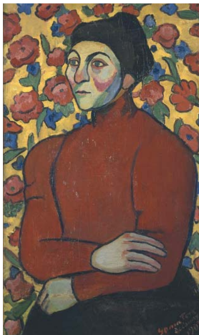
Sonia Delaunay: Philomena , 1907.

Pro většinu zahraničních Židů se však sen o lepším životě ve Francii proměnil