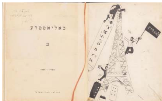
Jidiš časopis Kaliastra s ilustrací Marca Chagalla.

K nejpůsobivějším exponátům patří dřevěná, lidskou rukou jakoby nedotčená socha Prorok od Ossipa Zadkina, původem z Vitebska, jehož umění ovlivnil jak kubismus, tak africké a řecké umění. České země zastupuje Georg Kars, rodák z Kralup nad Vltavou: k vidění je ženská postava, ale především nervní autoportrét z roku 1929. Připomeňme, že Kars se