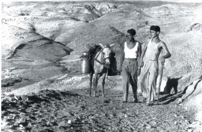
Izrael před pětasedmdesátí lety. Golanské výšiny 1948, foto Jindřich Marco.

Je-li něco, co ten model ilustruje, je to Netanjahuova justiční reforma, způsob jejího prosazení (má projít těsnou většinou 63 hlasů v Knesetu) i způsob, jak se proti ní protestuje v ulicích, na náměstích