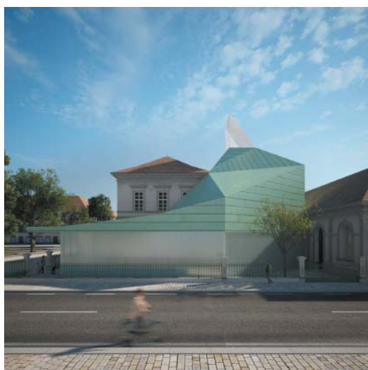
Vizualizace vítězného návrhu: pohled z boku Muzea ghetta z Pražské ulice.

Spolupracujeme s radnicí a s institucí, kterou zřídilo město a Ústecký kraj