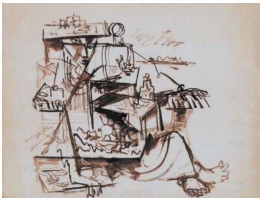
Postava, kvaš, papír, 40. léta.

1992 Paříž) pocházela z pražské židovské intelektuální rodiny, otec MUDr. Arnošt