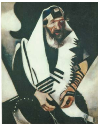
PAVEL HOŠEK Chasidské příběhy Mezi židovskou mystikou a krásnou literaturou CENTRUM PRO STUDIUM DEMOKRACIE A KULTURY

Je chasidské vyprávění „chasidským vyprávěním“ prostě proto, že vychází z tohoto prostředí, nebo musí splňovat ještě další předpoklady, aby jim bylo?