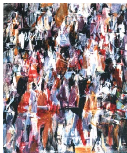
Dav I , olej na plátně, 1979.

Přibližně od počátku šedesátých let se její přístup podstatně změnil. Dosavadní světlé pozadí obrazů se změnilo na temnou plochu, z níž jako z hloubky tmavých vrstev malby nebo chaosu barevných skvrn vystupují opět nejasné náznaky figurace.