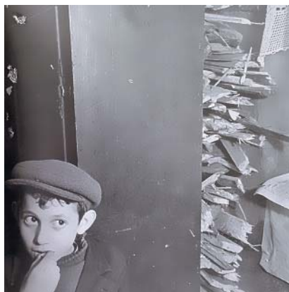
Roman Vishniac: Židovský chlapec z Krochmalné ulice v předválečné Varšavě, 1934–1938.

ským institutem v Praze a Městskou knihovnou v Praze a pod záštitou Federace židovských obcí v ČR. Malý sál Městské knihovny v Praze, Mariánské nám. 1, Praha 1. Film s českými titulky trvá 86 min., není vhodný pro děti do 12 let. Vstup volný, nutná rezervace na tel. č. 220 410 410 nebo e-mailu praga@instytutpolski.pl .