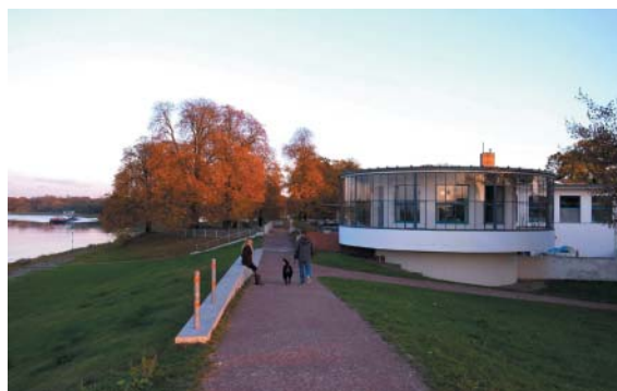
Příjemná kavárna Kornhaus u Labe.

(a nejen v ní) zvítězí osvícený duch starosty Hesseho a nikoli temné přízraky minulosti.