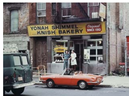
... ale pekařství Yonaha Schimmela dodnes funguje.

Návštěvníci mohou v synagoze na Eldridge Street obdivovat také jedno z posledních děl na podzim zesnulého malíře Marka Podwala: pestrobarevnou mozaiku zvěrokruhu, ve které je každé znamení propojené s konkrétním písmenem hebrej-