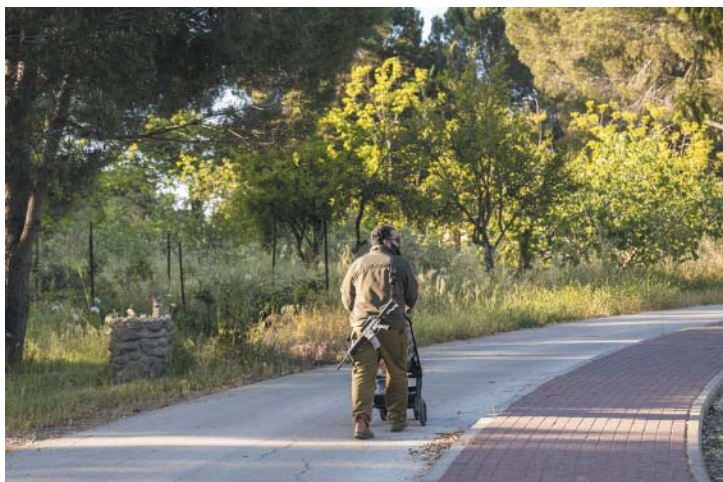
Otec s dítětem v kočárku. Kibuc Oral, Golanské výšiny. Foto Karel Cudlín, 2024.

nější plán pro vznik dvou států od éry Billa Clintona?