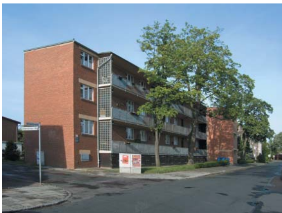
Činžovní domy s pavlačemi dodnes slouží k bydlení.

Centrum spravuje desavská společnost Mosese Mendelssohna a její nadace. V domě má stálou expozici o Mendelssohnovi a regionální historii německých