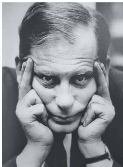
Architekt Walter Gropius, zakladatel a první ředitel Bauhausu.

1932) a s dědictvím originálních staveb se během nacismu a komunismu nezačázelo právě šetrně, nezaujatě. Dodnes