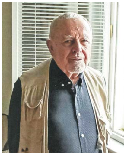
Jan Klusák, 2024.

No, já jsem o tom přemýšlel, byla víc česká než židovská, pokud jde o tu úz-