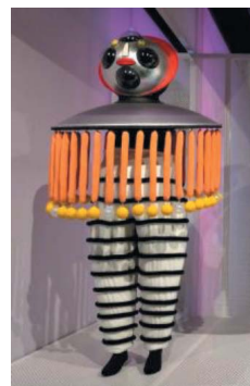
Rekonstrukci baletního kostýmu O. Schlemmera naleznete v Muzeu Bauhausu.

a nepřítazlivost“ a to, že ve své střizlivosti prý Bauhaus vytlačuje regionální tradice. Doufáme, že v této absurdní záležitosti