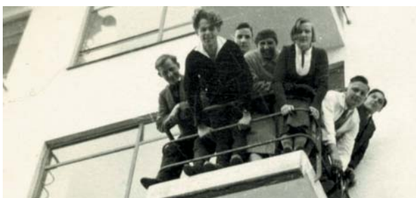
Starý snímek studentů, jak se naklánějí přes povážlivě nízké zábradlí.

o geometricky uspořádaný mikrokosmos, jehož jednotlivé stavební části se vzájemně prolínají a vytvářejí samostatné městečko. Na Hesseho žádost Gropius