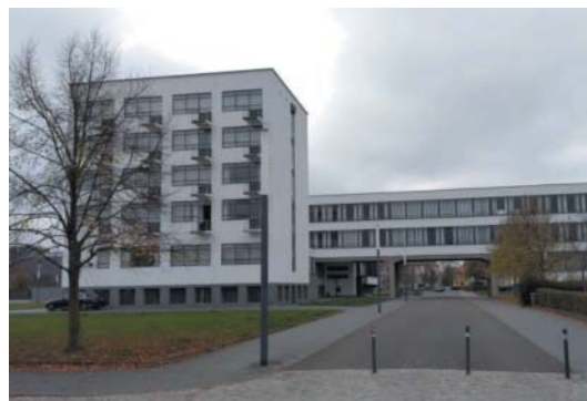
Učiliště Bauhaus v Desavě, vlevo studentské ubytovny.

Tak v Desavě v letech 1926–1928 (podobně jako již dříve v Bačově Zlíně) vznikla celá kolonie pro místní dělníky i administrativní pracovníky zdejšího průmyslu a několik činžovních domů, dále úřad práce a družstevní prodejna. U Labe pak vyrostla příjemná zahradní kavárna... I když Bauhausu bylo dopřáno působit v Desavě pouhých šest let (1926–