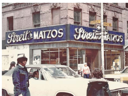
Rodinný podnik Streit's Matzos už nenajdete...

s drogami apod. Toto desetiletí bylo však také dobou, kdy se do polorozpadlých bytů s nízkým nájemným začali stěhovat mladí umělci, z nichž někteří se později proslavili, jako např. Keith Haring či Jean-Michel Basquiat. Na Lower East Side se tehdy také zrodil street art a začínala tu řada známých hudebních skupin – mj. Velvet Underground.