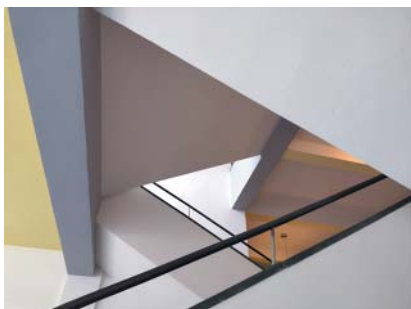
Jedno ze schodišť v hlavní budově školy.

Dodnes, byť kolem ní vznikly další (naštěstí nízké) budovy, působí elegantně, vzorně, jakoby mimo čas. Jedná se