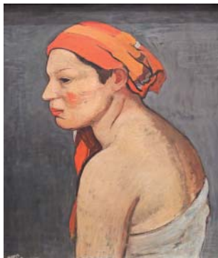
G. Kars: Žena v šátku , 1930. Retro Gallery.

li do konce války. Při návratu do osvobozené Paříže Kars v důsledku nervového vyčerpání a zpráv o obětech šoa doma i v Paříži spáchal v Ženevě 5. února 1945 sebevraždu skokem z okna hotelového pokoje. Letos uplyne od jeho smrti osmdesát let.