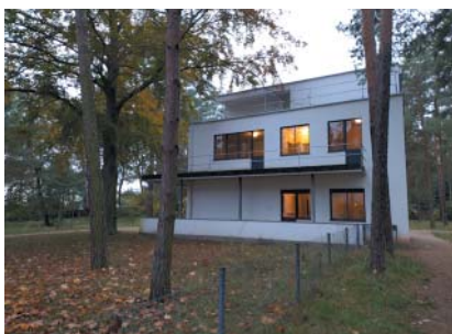
Veřejnosti přístupný dvojdomek v parku, v němž žili Paul Klee a Vasilij Kandinskij.

Židů v Anhaltsku. V expozici lze nalézt například originální vydání učencových spisů, faksimile dopisů i novější literaturu. Je tu i model smuteční síně na židovském hřbitově v Desavě, zničeném v roce 1938. Další slavný židovský rodák je též připomínán v kulisách Bauhausu. Jedná se o skladatele Kurta Weilla (1900–1950), syna místního rabína a autora známé Trígrošové opery . Weill musel po úspěšné hudební kariéře opus-