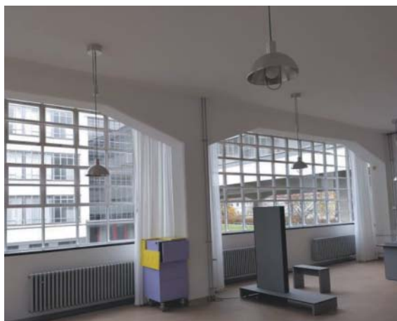
Bývalá dílna, průhledem je vidět spojovací most.

O původní podobě i interiéru a zahradě dodnes vypovídá dům Anton. Roku 1992 bylo ve zrekonstruovaném domě Mittlering 38 otevřené Centrum Mosese Men-