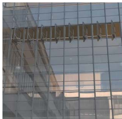
Skleněná opona, hra světla a stínů.

Návštěvníka čekají v Desavě další zastavení: Původní Gropiova kolonie Törten z let 1926–1928 (tehdy jižní vesnic-