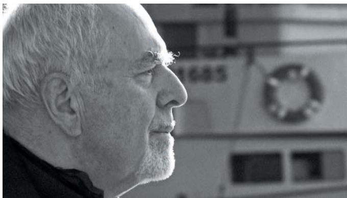
Foto z filmu Jan Klusák - Axis Temporum (2009), režie Dan Krameš.

Já jsem měl v životě na dirigenty štěstí. Hned po mém absolutoriu se mě ujal doktor Václav Smetáček, který hrál mou První symfonii (tak to říkám, ale je to pravda) ve všech světadílech kromě Antarktidy. On jezdil hodně po světě a ta První symfonie byla taková jako snadno hratelná, Smetáček říkal, že se to nemusí moc zkoušet a že je to dobrý číslo na začátek programu. Takže všude, kam přijel, tak ji dával, v Austrálii a na Novém Zélandě, v Moskvě a v Bue-