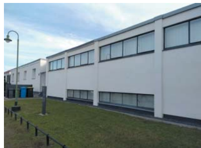
Tak vypadal Törten (Centrum M. Mendelssohna).

Jenže: Ani při příjemném posezení u líné tekoucí řeky se nemůžeme vyhnout připomínce, jak Bauhaus v Desavě skončil