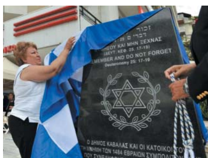
Opožděné odhalení památníku, červen 2015.

Skutečné bohatství ale Kavale přinesl tabákový průmysl. Město zpracovávalo a exportovalo nejvíce tabáku z celého Balkánu. Z tabákového průmyslu a narůstajícího bohatství v Kavale těžila i židovská komunita. Na konci 19. století byla dokonce ve městě zřízena židovská škola a univerzita. Židé na severu Řecka počátkem 20. století prosperovali, a to