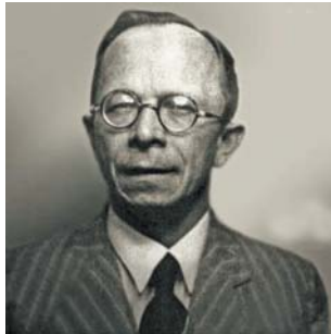
Vladimír Vochoč.

Vědecká knihovna v Olomouci obohatila své fondy o významnou sbírku judaik a hebraik, kterou daroval profesor Gad Freudenthal. Tento soubor, čítající stovky svazků, představuje jednu z největších sbírek svého druhu v České republice. Sbíрка pokrývá široké spektrum témat – od židovské filozofie a historie až po mystiku a arabské vědy. Na zpracování a zaevidování sbírky do katalogu VKOL usilovně pracoval tým katalogizátorů a studentů judaistiky. Knihovna nyní dokončuje katalogizaci a zpřístupnění knih. Sbíрка je unikátní svým rozsahem