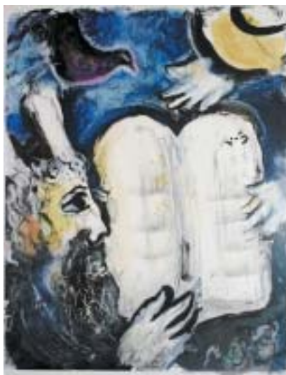
Litografie: Marc Chagall.

obličej světlem. Jak mu předtím Bůh řekl: „Všechn ten lid, v jehož nitru jsi, spatří, jak děsivý je to skutek, který s tebou konám!“ K tomu je však třeba dodat, že něco podobného se stalo každému z těch, kdo v den Svátku darování Tóry byli přítomní zjevení Božího majestátu na Sinaji, kdy je Bůh oslovil v jejich nejhlubším nitru prvními příkazy Desatera: Já jsem Hospodin, tvůj Bůh, jenž tě vyvedl z Micrajim, z domova otroků. Nedělej si jiné bohy na mé tváři! To byl totiž důvod, proč lid, vědom si svého hříchu, odložil každý svou ozdobu ze Sinaje (2M 33,6). Tóra nijak nespécifikuje, co vlastně byla tato ozdoba , ale je zřejmé, že to byl odraz Boží přítomnosti, podobně jako světlo, vyzařující z Mošeho obličej po jeho druhém sestupu. Zatímco v Den smíření jeho obličej zářil vnitřním světlem, oni Mošeho očekávali, zbaveni svých ozdob. Výklad možná nalézáme v obraze spravedlivých v životě olam haba , kde podle Berachot 17a spravedliví sedí se svými korunami na hlavách a těší se ze svitu Boží přítomnosti , ale i v citátu